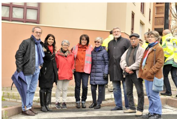
Opération propreté de la ville , Mars 2016