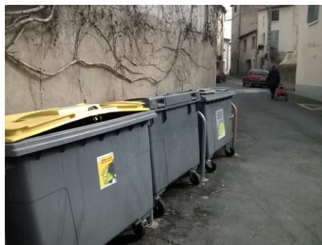
1 container sur 2 placé à l'envers....