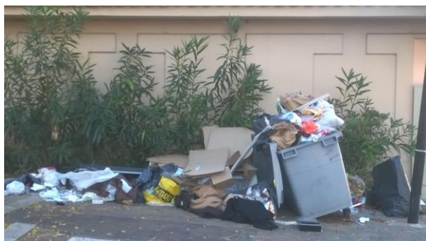
Resté en place plus d'1 semaine....