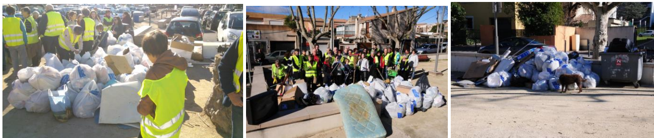
Récolte journée citoyenne propreté (2014)